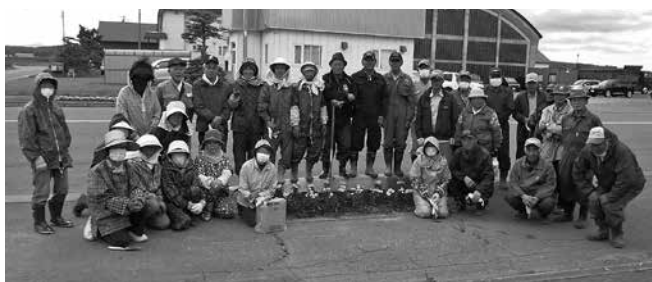
(老人クラブ 追分市街 令和5年6月5日)

雨竜町社会福祉協議会では、例年、明るい街づくりの一環として「環境美化花いっぱい運動」を実施しており、今年も第1町内の1、第2町内の1・2・3、第3町内(川上地区)、第5町内の1・2、第6町内の1・2の各地区のみなさんの協力により、それぞれのコミュニティセンターなどの花壇に花植えを行っていただきました。また、老人クラブ連合会でも会員約70名が参加して、雨竜市街、追分市街の国道沿いにマリーゴールドの花苗の移植を行っていただきました。いずれも、地域の方々や道行く人の目を和ませています。