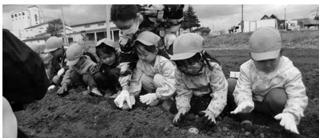
(食育事業 種いも植え 令和5年5月)