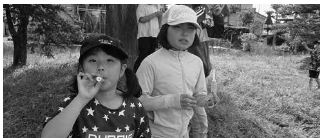
(屋外でシャボン玉遊び 令和5年6月)