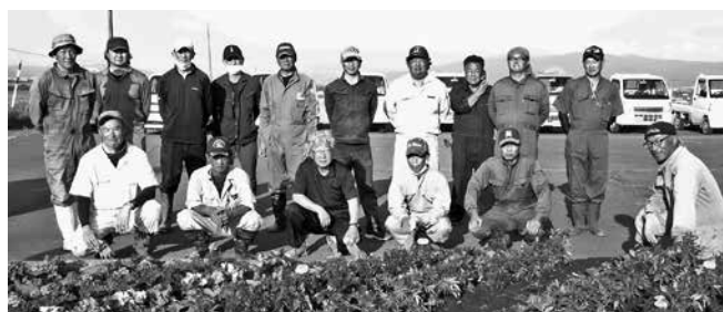
(第5町内の1 洲本コミセン 令和5年6月8日)