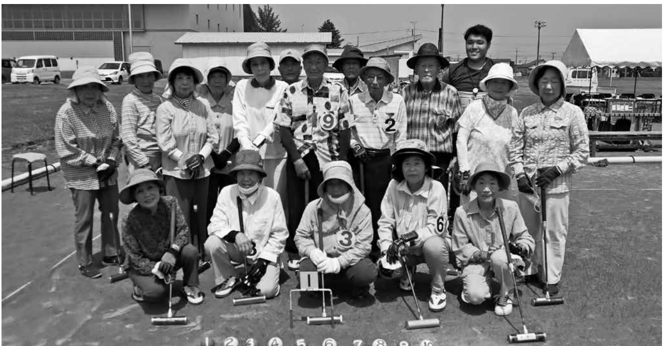
(7.21雨竜町老人クラブ連合会 第54回ゲートボール大会)