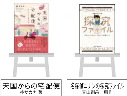
天国からの宅配便 椋サカナ 著