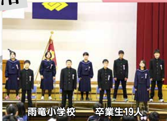
雨竜小学校 卒業生19人