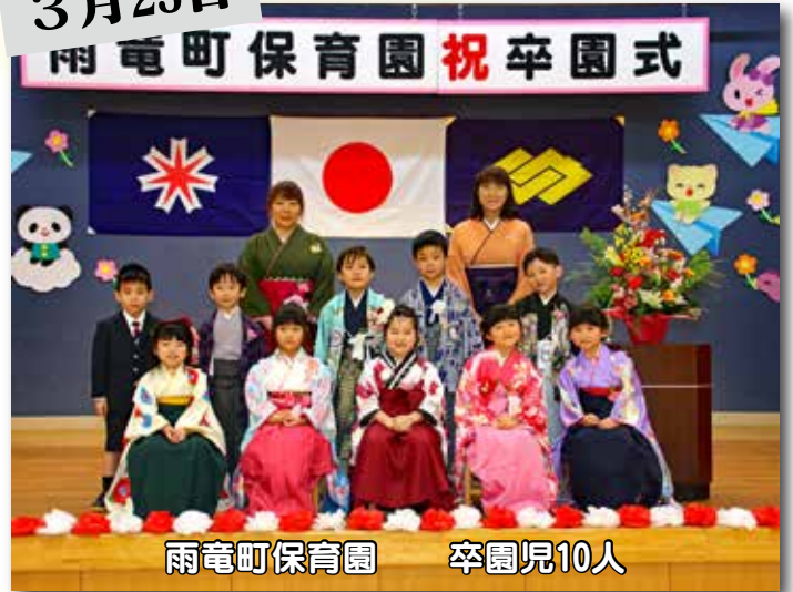
雨竜町保育園 卒園児10人

式典では在校生代表の送辞でお世話になった卒業生へ感謝の言葉が贈られたあとに、卒業生代表の答辞では「入学したばかりの時にみんなで協力して、きれいな花壇を作れた時が嬉しかった」など高校生活の思い出が述べられました。在校生へ向けて「これから悔しいこと、辛いことがあると思いますが、後輩の良き見本となるように頑張ってください」とメッセージが贈られました。