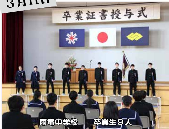
雨竜中学校 卒業生9人