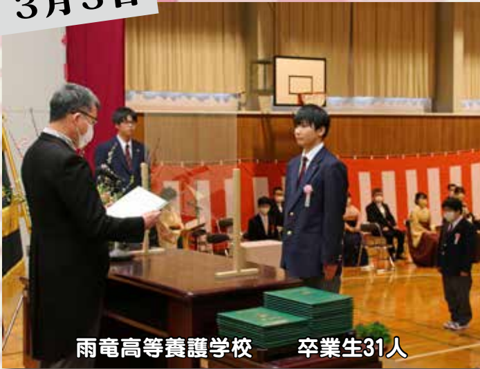
雨竜高等養護学校 卒業生31人