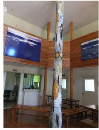
南暑寒荘（定員70名、4室） ホール