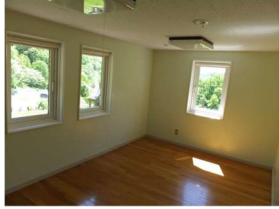
宿泊部屋 （寝具は各自持参）