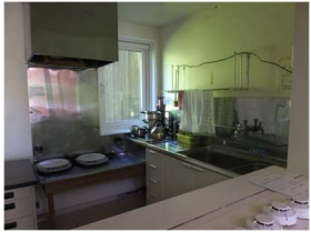
調理室 （電磁調理器、鍋あり）