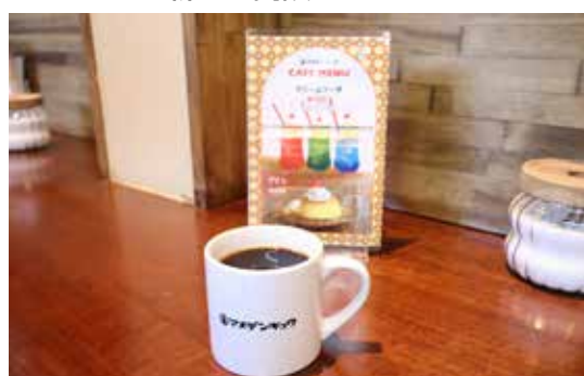
↑コーヒーはテイクアウトも可能