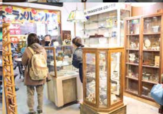
オープン当日賑わう店内