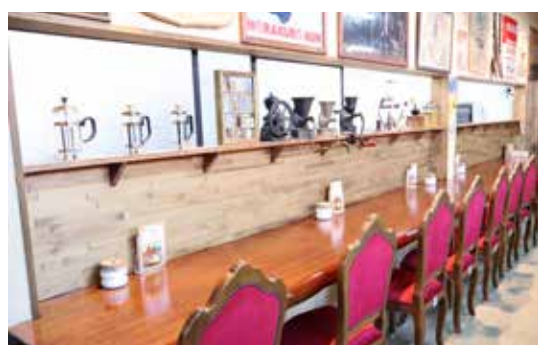
↑新しく開設したカフェ

レトロコミュニティ「豆電球」は地域の憩いの場として、訪れる人々を温かく迎えてくれます。