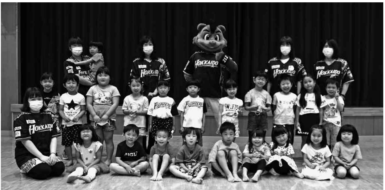
(6.17日本ハムファイターズB☆Bほか保育園訪問)