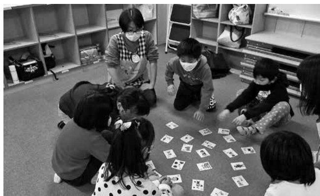
(かるたで学ぶ雨竜・空知・北海道 令和3年2月)