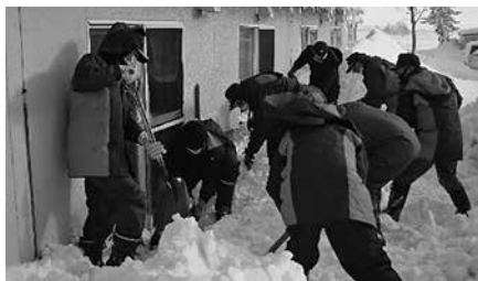
1月31日 消防第1分団の皆さん