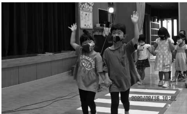
(交通安全教室 令和2年9月)