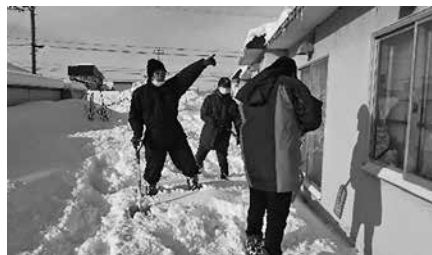
1月31日 消防第2分団の皆さん