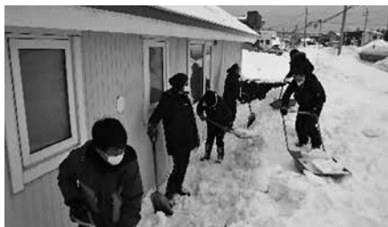
1月26日 暑寒の里の皆さん

今年も1月26日から2月9日までの内、4日間にわたり、暑寒の里、雨竜高等養護学校2年生、消防団員の方々延べ93名に独居高齢者等の住宅14戸の除雪ボランティアを行っていただき、皆さんに大変感謝されました。